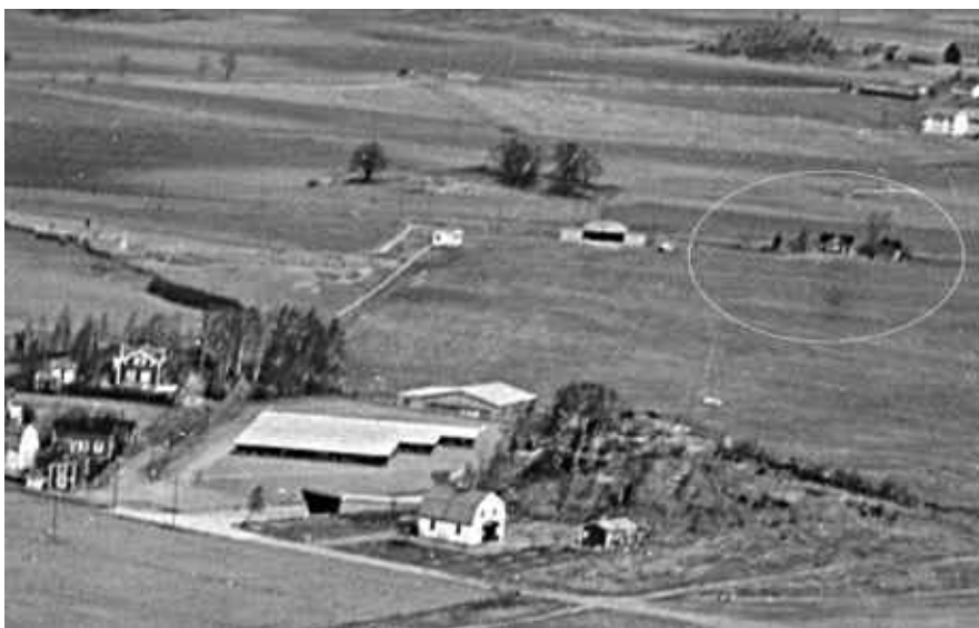
Råberga hållplats inringad i bildens högra del. Foto från omkring 1950.

Några av de byggnader som finns till vänster och även flygklubbens hangar finns ju