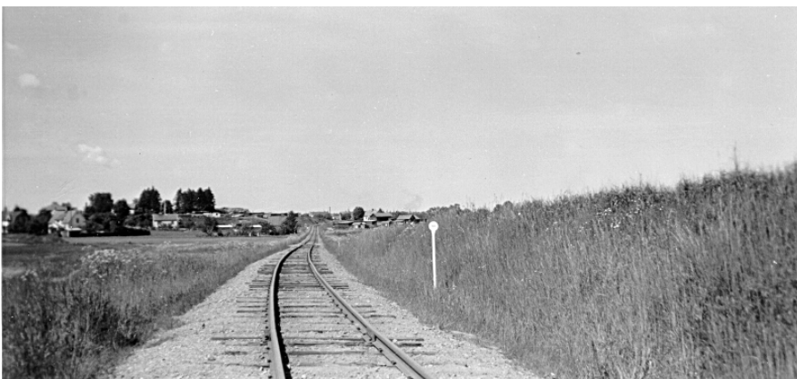
Utfarten från Råberga hållplats in mot Linköping, raksträckan som gick fram till övergången av Östra stambanan .