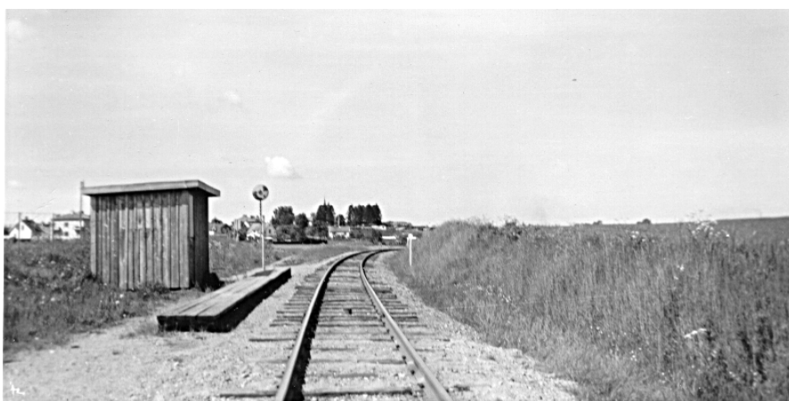
Bilden ovan visar den hållplatskur som på senare år användes vid Råberga hpl.

Enligt en värdering av byggnader vid MÖJ 1918 fanns vid Råberga ett boningshus ( 7500:-), ett uthus ( 1200:-) och ett avträde värderat till 150:-. Naturligtvis fanns också en