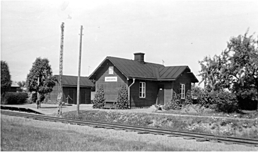
Vårdsbergs hållplats på MÖJ, på sträckan Linköping - Ringstorp var närmaste hållplatsen med stuga österut från Råberga.

riktig matkällare invid huset, något som var lika naturligt som att vi har kylskåp i varje hus nuförtiden.