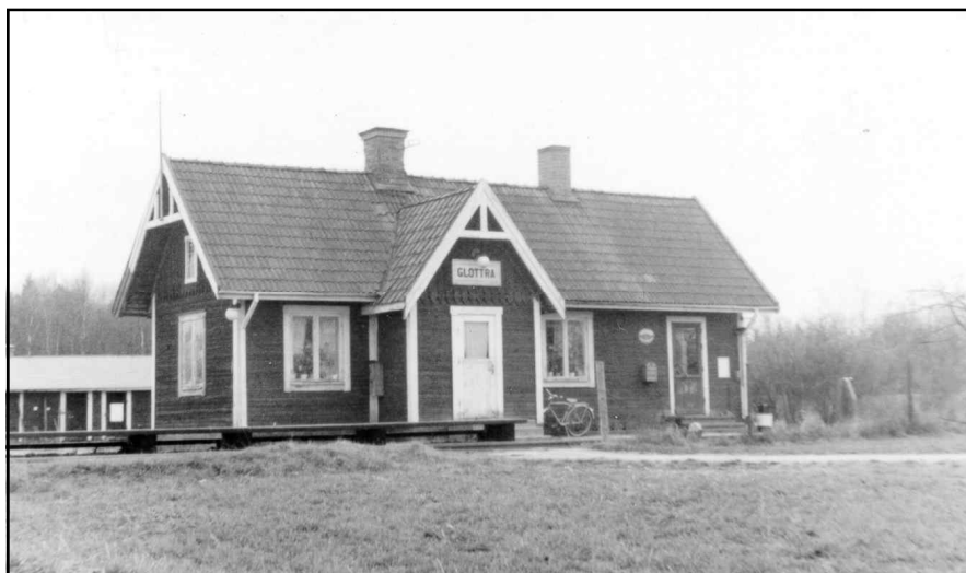
Glottra hållplats någon gång på 50-talet

Glottra hade under en period ett sågverk dit stockar flottades på sjön. Ett stickspår anlades ner till sågverket som låg alldeles nere vid sjön. Se kartskissen nedan som är NÖJ:s ritning när stickspårets byggdes, tyvärr är ritningen odaterad varför jag inte vet exakt när stickspåret lades in. Det är kanske någon läsare